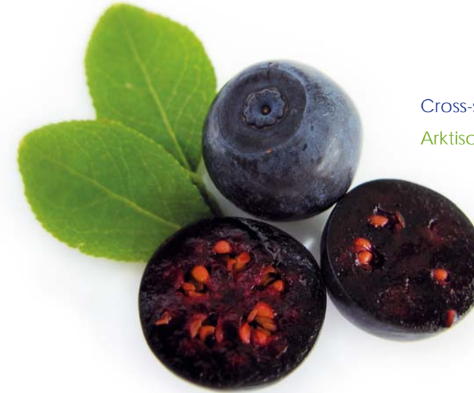
Cross-section of an Arctic bilberry

Mit einem Durchmesser von 6 bis 8 Millimetern ist die arktische Heidelbeere kleiner als die hochbuschige Kulturheidelbeere. Arktische Heidelbeeren wachsen einzeln an den Zweigen eines verästelten Strauches von 10 bis 40 Zentimetern. Die mit einer hauchdünnen Wachsschicht überzogene dunkelblaue Schale der arktischen Heidelbeere ist weich und bricht leicht.