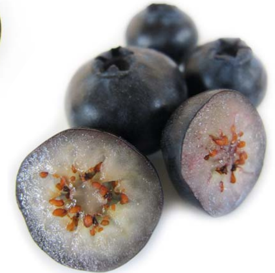
Cross-section of a cultivated blueberry